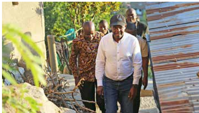
Waziri wa Maji, Mhe. Profesa Makame Mbarawa akikagua ubunifu uliotumika katika ujenzi wa mradi wa maji taka, Mabatini mtaa wa Unguja wilaya ya Nyamagana. Mradi huo umejengwa katika vilima na umesaidia kuondosha uchavuzi wa mazingira na magonjwa ikiwamo Kipindupindu.