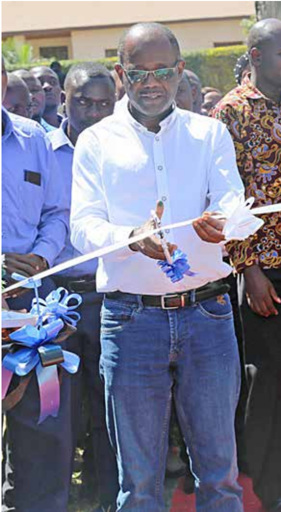
Waziri wa Maji, Mhe. Profesa Makame Mbarawa akikata utepe kuzindua rasmi matumizi ya mita za malipo kabla kwa huduma ya maji jijini Mwanza.