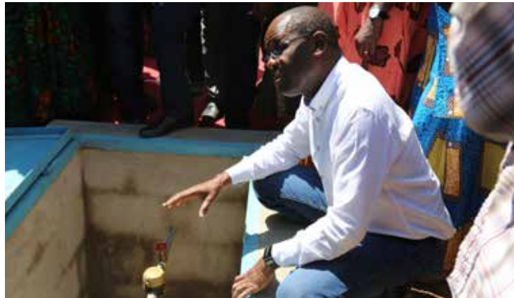
Waziri wa Maji, Mhe. Profesa Makame Mbarawa akiangalia mfumo wa Dira za malipo kabla ya huduma ya maji, mara baada ya kuzindua matumizi ya mita hizo, jijini Mwanza.