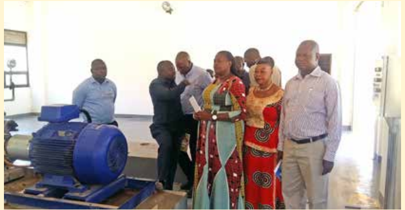
Wajumbe wa Bodi na baadhi ya watumishi wa MWAUWASA walipotembelea chanzo cha maji cha Mzakwe Jijini Dodoma wakimsikiliza mtaalam (hayupo pichani) akiwapatia maelezo ya shughuli zinazofanyika maeneo hayo.

Ziara hiyo ya Bodi ya MWAUWASA kwenye mamlaka hizo, vilevile ilihusisha baadhi ya watumishi wa MWAUWASA kutoka vitengo mbalimbali ambao waliambatana na wajumbe wa Bodi.