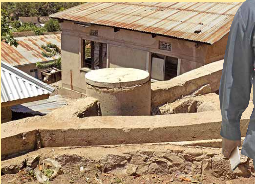
Mfumo wa Majitaka

■ Kwa miradi inayotekelezwa kupitia mfuko wa EU-AITF