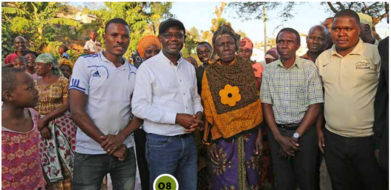
Waziri wa Maji Mhe. Profesa Makame Mbarawa (Mb) katika picha ya pamoja na wakazi wa Mabatini, mtaa wa Unguja walionufaika na mradi wa Maji taka. Mhe. Mbarawa amehidi kila mkazi kuunganishwa katika mradi huo.