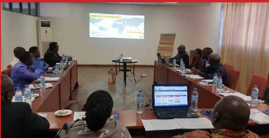
Washiriki wa mafunzo ya uandaaji wa Mpango wa Usalama wa Maji yanayotolewa na Jumuiya ya Kimataifa ya Maji (IWA) wakifuatilia mafunzo.