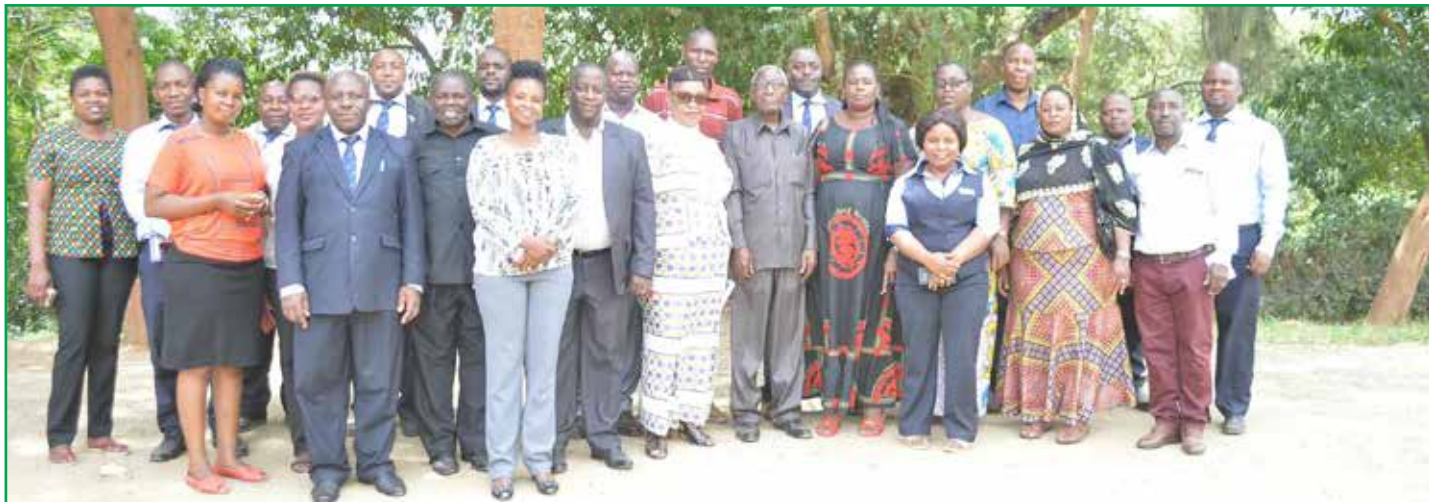
Wajumbe wa Bodi za Wakurugenzi MWAUWASA na IRUWASA wakiwa katika picha ya pamoja na baadhi ya watumishi wa mamlaka hizo mara baada ya kukamilisha ziara ya kwenye maeneo mbalimbali ya mnyororo mzima wa huduma ya maji Mkoani Iringa.

W atumishi Mamlaka za Maji nchini wameaswa kushirikiana ili kuboresha shughuli zao sambamba na kuongeza kasi ya usambazaji wa huduma ya maji kwenye maeneo yao.