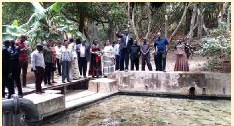
Wajumbe wa Bodi na baadhi ya watumishi wa MWAUWASA walipotembelea chanzo cha maji Chemchemi ya Kitwiro Mkoani Iringa.