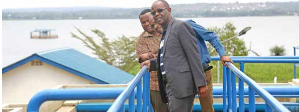
Waziri wa Maji Mhe. Profesa Makame Mbarawa (Mb) akikagua mradi wa maji wa Nansio. Vyanzo vya maji vya uhakika ni muhimu katika kuhakikisha wananchi wengi wanapata huduma ya maji safi na salama kwa uhakika. Mradi wa maji wa Nansio unatoa maji katika Ziwa Victoria, na umetekelezwa kupitia Mamlaka ya Majisafi na Usafi wa Mazingira Jijini Mwanza (MWAUWASA).

Waziri Aweso aliwaelekeza viongozi wote kuanzia ngazi za mtaa mkoani Manyara kulinda na kuelimisha kuhusu umuhimu wa kutunza vyanzo vya maji kwa maendeleo ya kila mwananchi. Aidha, alikumbusha hairuhusiwi kufanya shughuli yoyote ndani ya mita 60 kutoka chanzo cha maji.