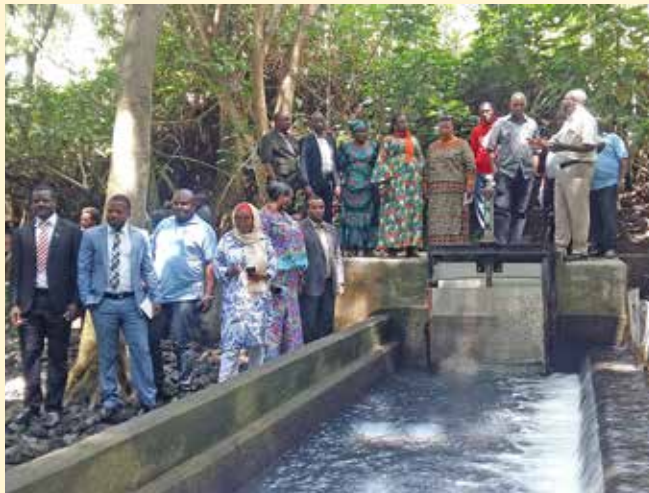
Wajumbe wa Bodi za Wakurugenzi MWAUWASA na wenyeji wao Mbeya UWSA walipotembelea chanzo cha maji cha Iyumwe.