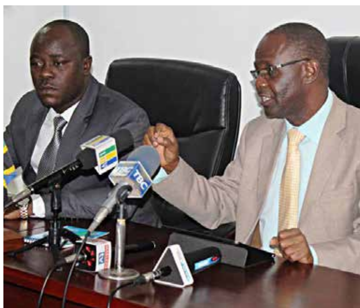
Waziri wa Maji, Mhe. Profesa Makame Mbarawa (Mb) akiwa na Naibu Waziri wa Maji, Mhe. Jumaa Aweso (Mb) kwenye moja ya mkutano na waandishi wa habari (hawapo pichani)