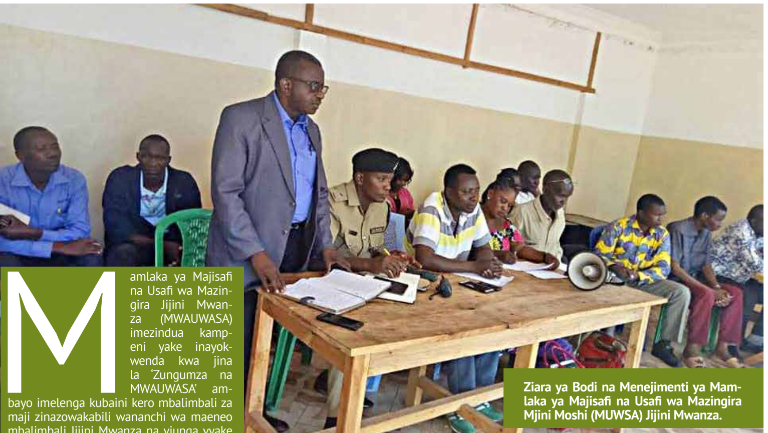
Ziara ya Bodi na Menejimenti ya Mamlaka ya Majisafi na Usafi wa Mazingira Mjini Moshi (MUWSA) Jijini Mwanza.

M amlaka ya Majisafi na Usafi wa Mazingira Jijini Mwanza (MWAUWASA) imezindua kampeni yake inayokwenda kwa jina la 'Zungumza na MWAUWASA' ambayo imelenga kubaini kero mbalimbali za maji zinazowakabili wananchi wa maeneo mbalimbali Jijini Mwanza na viunga vyake sambamba na kutoa elimu ya maji kwa wananchi.