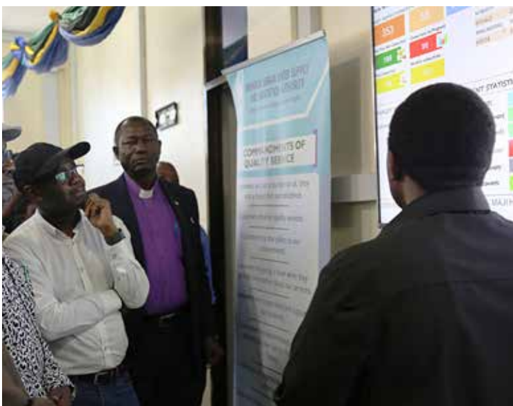
Waziri wa Maji, Mhe. Profesa Makame Mbarawa akipewa maelezo kuhusu dash board yenye taarifa mbalimbali kuhusu huduma kwa wateja na uwajibikaji katika Mamlaka ya Maji Safi na Usafi wa Mazingira jijini Mwanza (MWAUWASA)