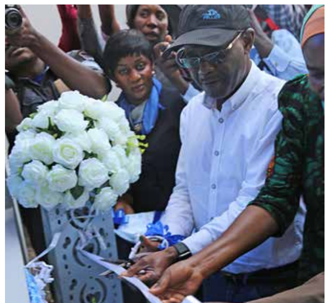
Waziri wa Maji, Mhe. Profesa Makame Mbarawa akifungua rasmi jengo la Mamlaka ya Maji Safi na Usafi wa Mazingira jijini Mwanza (MWAUWASA), Maji House.